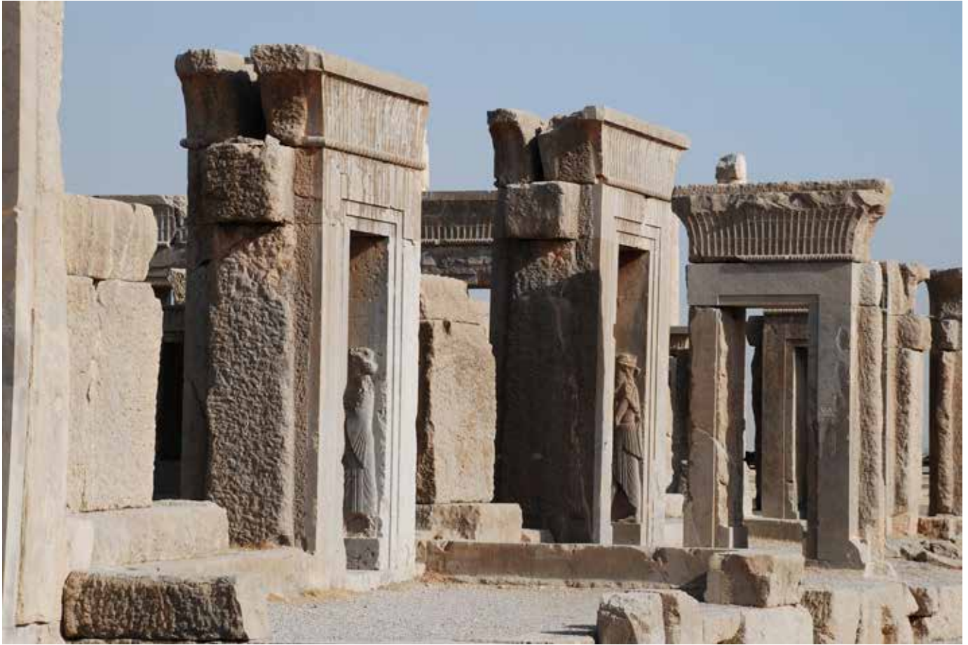
Фрагмент царского дворца Ахеменидов в Персеполе, VI–V вв. до н. э.)