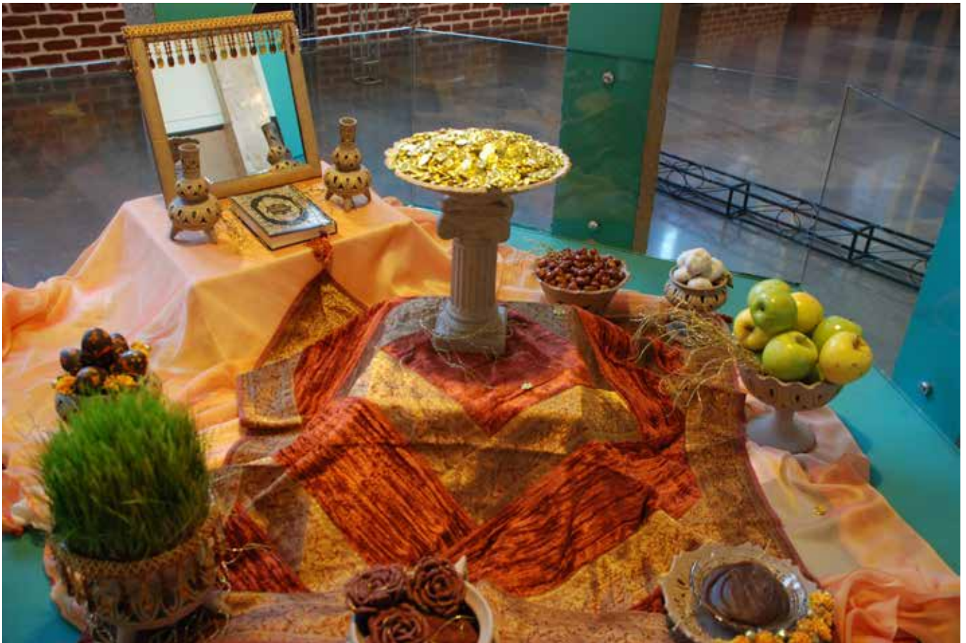
Хафт Син – символический набор предметов для украшения праздничного стола Нооруза – иранского Нового Года