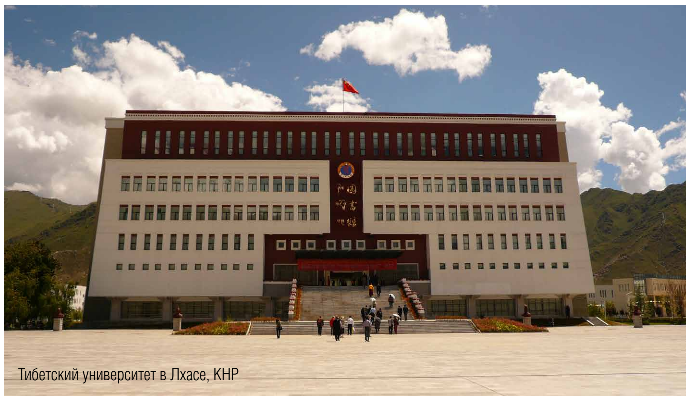
Тибетский университет в Лхасе, КНР