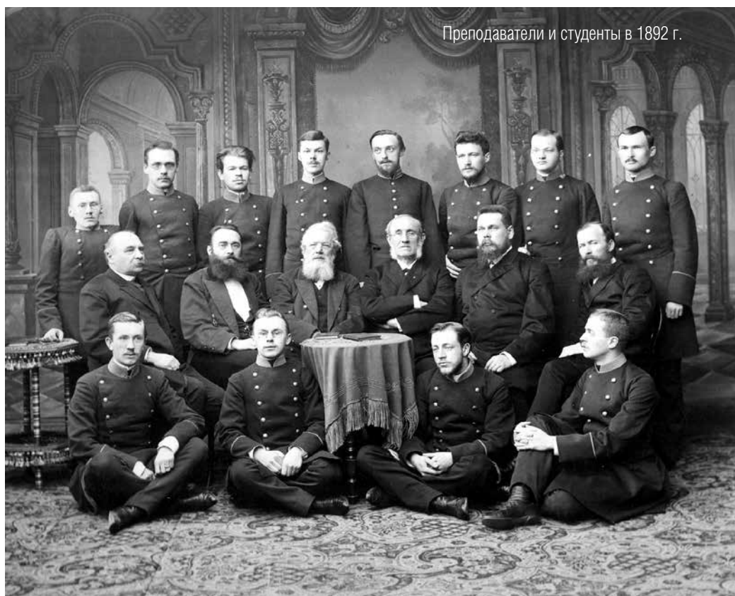
Преподаватели и студенты в 1892 г.

Кафедра китайской филологии — крупнейшая и одна из старейших на Восточном факультете. Преподавание китайского языка началось здесь с 1855 года. За полтора века кафедра прошла долгий и плодотворный путь развития, круг преподаваемых языков постоянно расширялся. Создание кафедры и первой на-