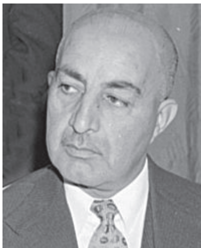
Мухаммад Дауд — премьер-министр Афганистана с 1953 по 1963 гг. ( с 1973 по 1978 гг. президент Республики Афганистан ) ru.wikipedia.org/wiki/Мухаммед_Дауд