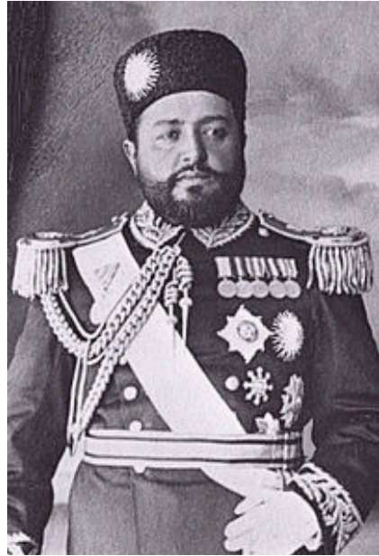
Эмир Афганистана Хабибулла-хан, правил с 1901 по 1919 гг. www.ru.wikipedia.org/wiki/Хабибулла-хан