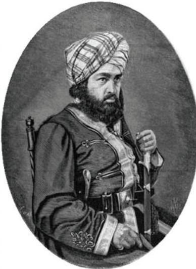
Эмир Абдурахман-хан, правил Афганистаном с 1881 по 1901 гг. http.afgh — hist.ucoz.ru