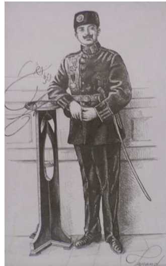
Эмир Аманулла-хан, правил с 1919 по 1929 гг. ru.wikipedia.org/wiki/Аманулла-хан