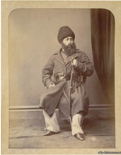
Шер Али-хан эмир Афганистана, правил с 1863 по 1866 и с 1868 по 1878 гг.