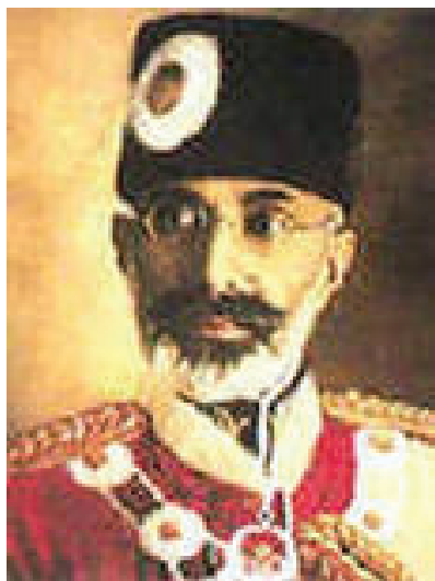
Надир-шах, правил в Афганистане с 1929 по 1933 гг.