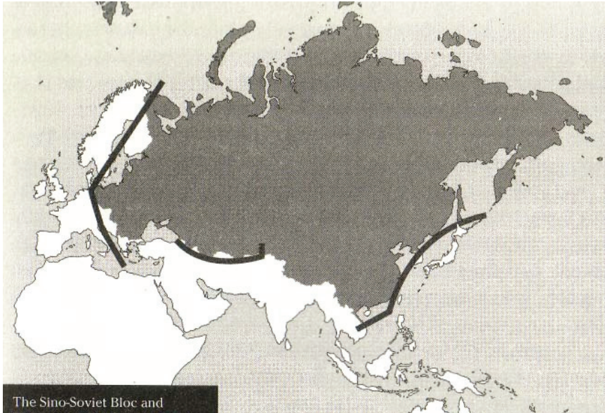
Карта З.Бжезинского. Советско-китайский блок и три центральных стратегических фронта 2

чества был решен невоенными средствами» 1 . «Периферия», особенно на восточном и южном стратегических фронтах холодной войны, сыграла чрезвычайно важную роль в политике сдерживания евразийских держав. США упорно выстраивали форпосты сдерживания на периферии, которые поддерживали напряженность в Евразии, индуцируя нестабильность, и одновременно грамотно использовали противоречия между СССР и КНР. Все это в комплексе и сыграло решающую роль в развале советско-китайского блока со всеми вытекающими отсюда последствиями.