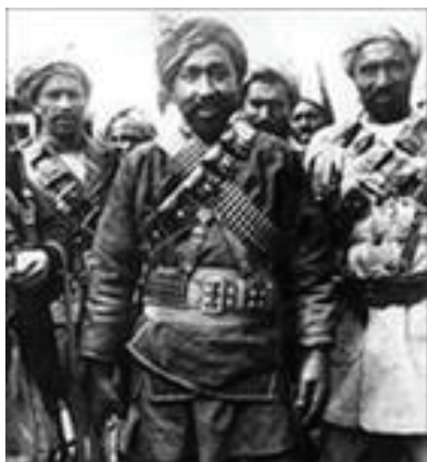
Эмир Хабибулла ( Бачча-йи Сакао — сын водоноса ) — в центре, правил в Кабуле в 1929 г.