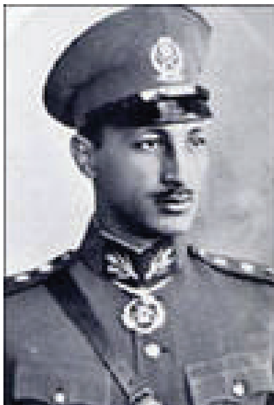
Мухаммад Надир-шах, правил в Афганистане с 1933 по 1973 гг. www.larc.sdsu.edu